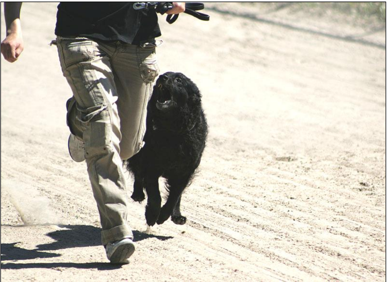
Rekolla on hauskaa